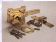
A3 - DORADO