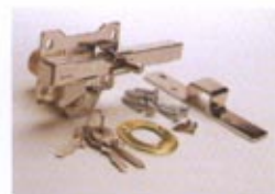
B3 - NIQUELADO