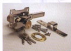
A3 - NIQUELADO