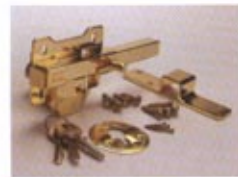
B3 - DORADO