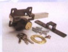
A3 - PINTADO