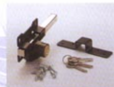
A3 - PINTADO S