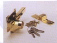
A3 - DORADO S