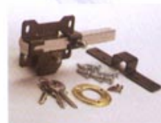
B3 - PINTADO