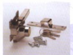
A3 - NIQUELADO S