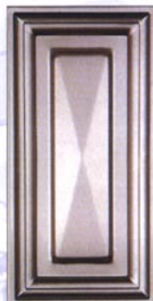
Mod. CRT 400 x 200 PD