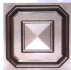
Mod. CRT 200 x 200 PD