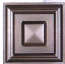
Mod. CRT 200 x 200 PD