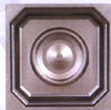
Mod. CRT 200 x 200 CO