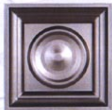
Mod. CRT 200 x 200 C