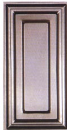
Mod. CRT 400 x 200 L