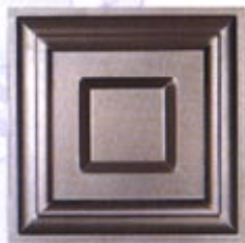
Mod. CRT 200 x 200 L