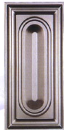
Mod. CRT 400 x 200 C